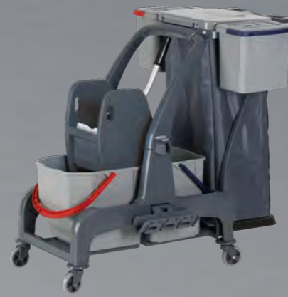
② COMBIX XL