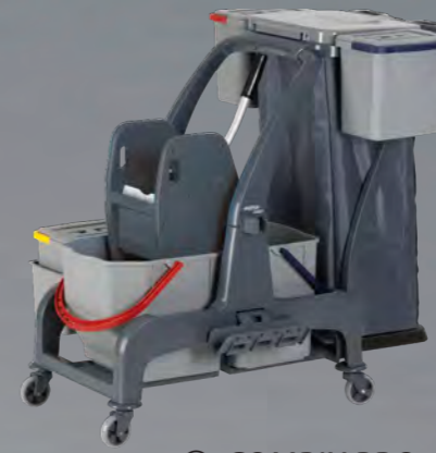
③ COMBIX PRO

Serienmäßiges Ablagefach für Reinigungsplan